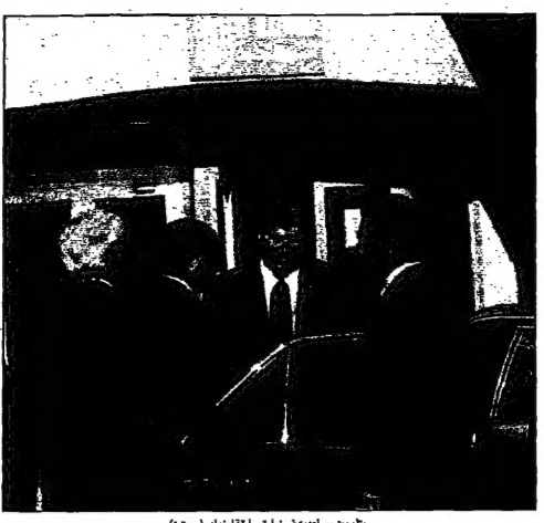
بيلر في زيارة سابقة لبيروت (مؤقت)